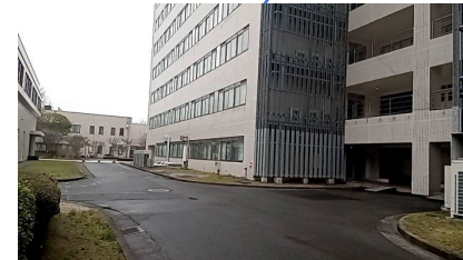
⑤バス方向転換場所 (液体窒素大型ローリー： 長10.5m×幅2.4m×高3.2mが 方向転換に使用)