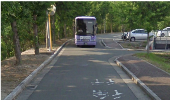
②周回路 (九工大スクールバス)